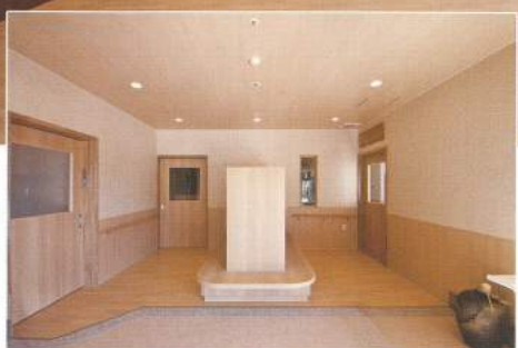
◀エントランス(風除室)