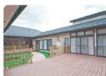
中庭(デッキテラス) 居 室