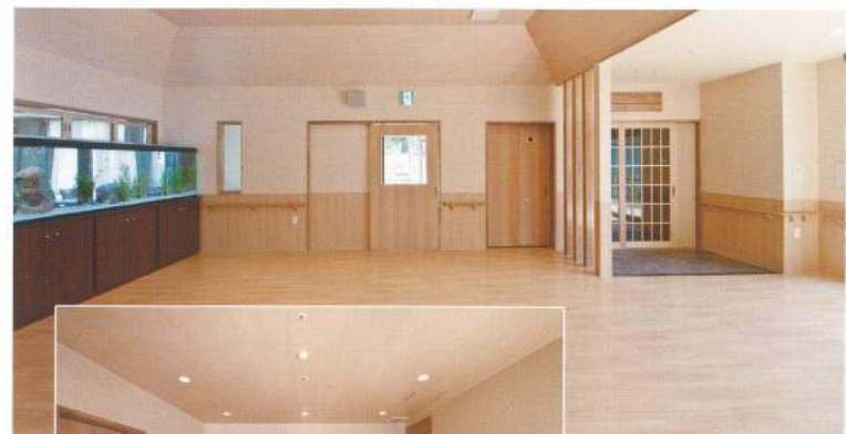
▲地域交流スペース

「小規模多機能型居宅介護つどい」は、利用者の方が、今までの人間関係や生活習慣などをできるだけ維持できるように、「通い」を中心に「訪問」「泊り」を一体化したサービスです。