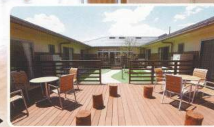
中庭(デッキテラス)▶