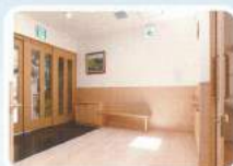
▲居室専用 エントランス